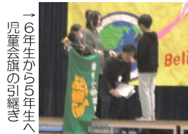
→6年生から5年生へ児童会旗の引継ぎ

令和6年度も、「夢いっぱい心豊かで しなやかにたくましく」成長する桐原小学校の子どもたちを、どうぞよろしくお祈りいたします。