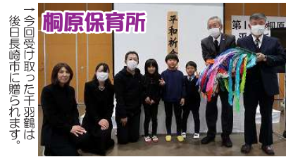
→ 今回受け取った千羽鶴は、後日長崎市に贈られます。