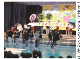
160名を送る会の様子