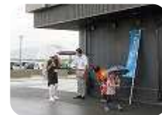
きりはら遊こども園