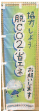
《中学生》 優秀賞の作品