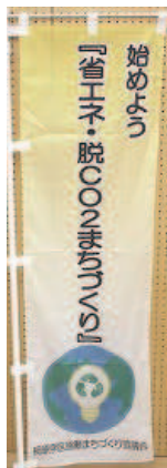
《高校生》 優秀賞の作品