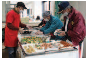
たくさんのおにぎり弁当を作りました。