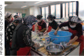
12月の開催時は、お菓子のクリスマスプレゼント付きでした。