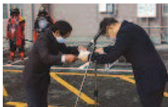
↑近江八幡地区防犯自治会長(小西市長)から表彰状が渡されました。

17年間にわたり地域の夜間パトロールを継続しています。月2回(基本第2・第4金曜日)21時より約45分間、