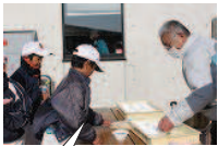
ゴールの後に、民生委員児童委員協議会の皆さんの手作りでぜんざいをいただきました。