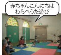
赤ちゃんこんにちば わらべうた遊び