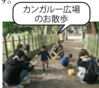
カンガルー広場の散歩

☆1月は5日から開館です。事業の詳細や予約は、センターまでお問い合わせください。電話・FAX 33-0703