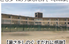
【暑さをしのぐすだれに感謝!】