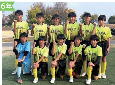
6年 ●JFA第47回全日本U-12サッカー選手権大会滋賀県大会出場! ●SFA第55回U-12サッカー選手権大会出場!

桐原ジュニアFCは桐原小学校で活動しているジュニアサッカーチームです。小学校1年生から6年生が対象となり、桐原小学校外からのメンバーも在籍しております。日々楽しく真剣にサッカーを取り組んでいます。Instagramで日々の活動を公開しております。